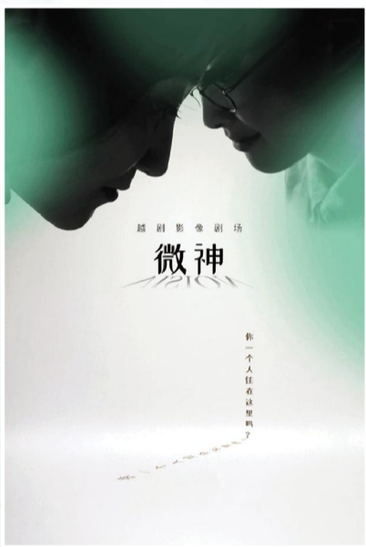
越剧影像剧场《微神》