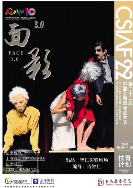
面具肢体剧场《面影3.0》